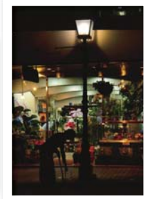
※写真は第5回フォトコンテスト受賞作品