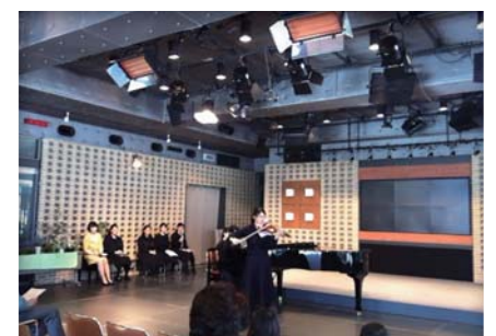
山手女子高等学校音楽科の演奏